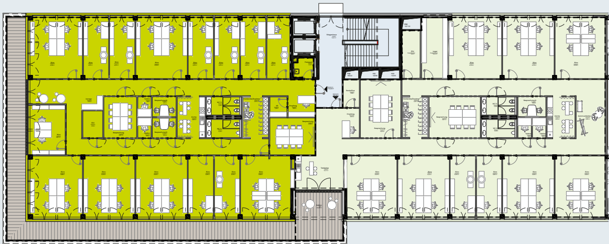
OFFICE LIGHT SÜD – ca. 703 m 2